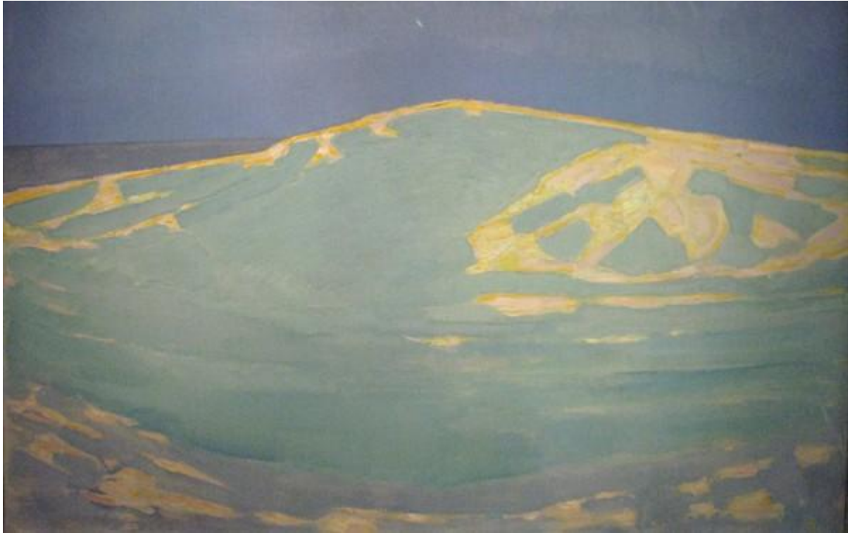
Piet Mondriaan, Duinen bij domburg, 1910