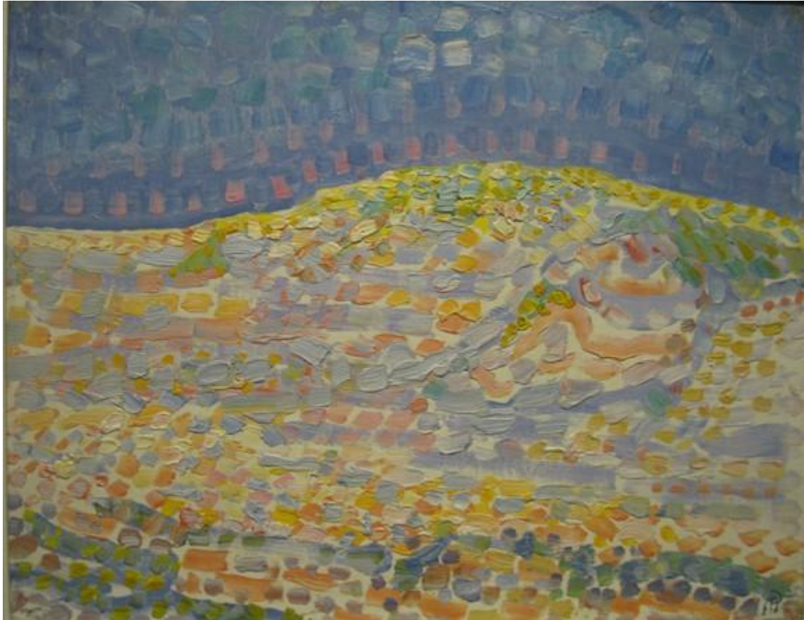
Piet Mondriaan, Duin II