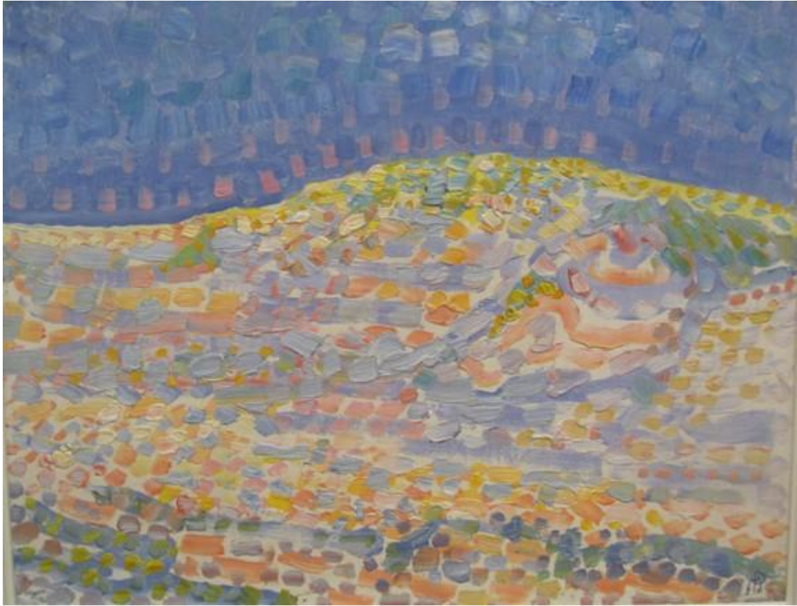
Piet Mondriaan, Duin II, 1909

Toorop en Mondriaan waren van af 1908 bevriend met elkaar. Toorop was bekend met het pointillisme van Seurat, en dat is hier op deze schilderijen ook terug te zien.