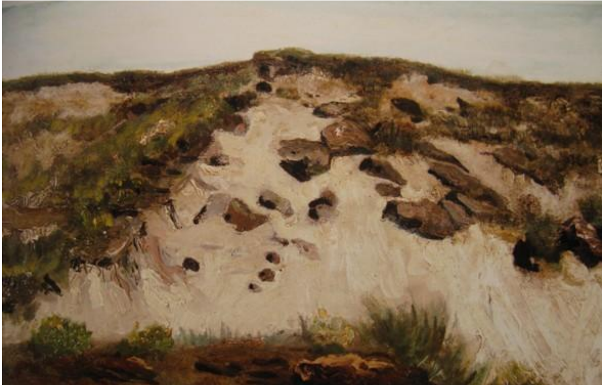
Vincent van Gogh, Duinen, 1882

In de tentoonstelling " Voorbij de horizon " (tot 7 februari 2010) in het Gemeentemuseum Den Haag hangen meerdere schitterende duin-schilderijen van Mondriaan.