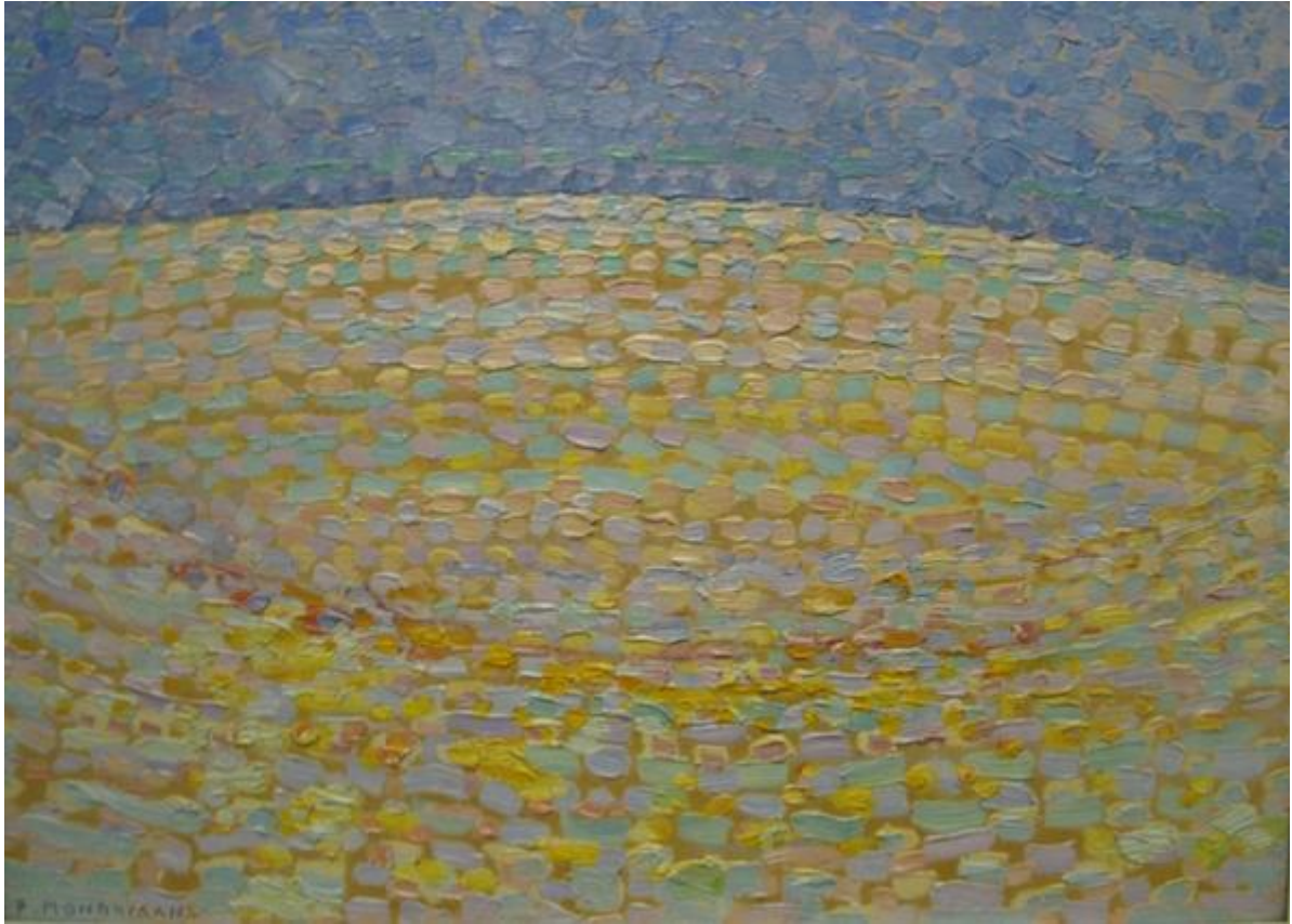
Piet Mondriaan, Duin I