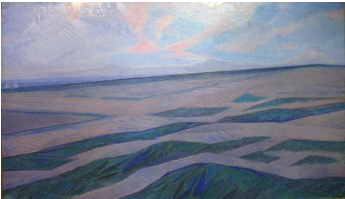
Piet Mondriaan, Duinlandschap, 1911