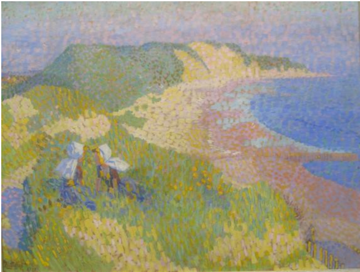
Jan Toorop, Duinen en zee in Zoutelande, 1907

Twee mooie moderne schilderijen van de duinen waren te zien in het Haagse Gemeentemuseum (‘De XXste eeuw’)